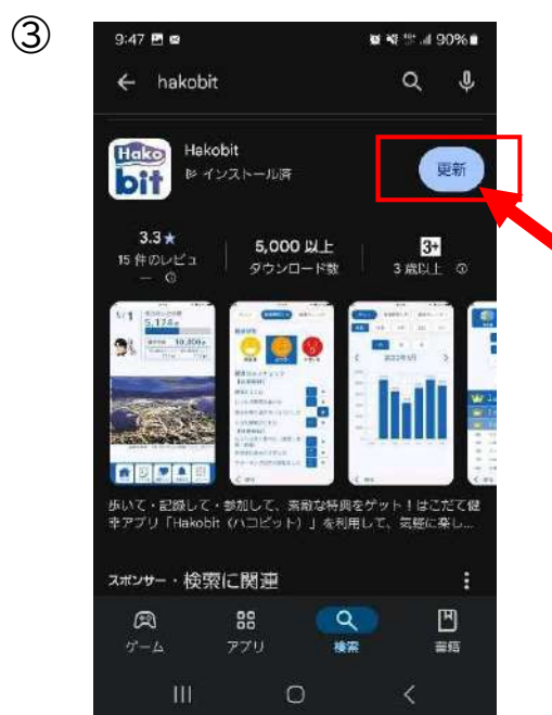
Playストア アプリの画面