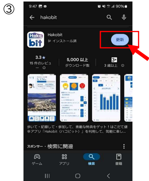
Play ストア アプリの画面