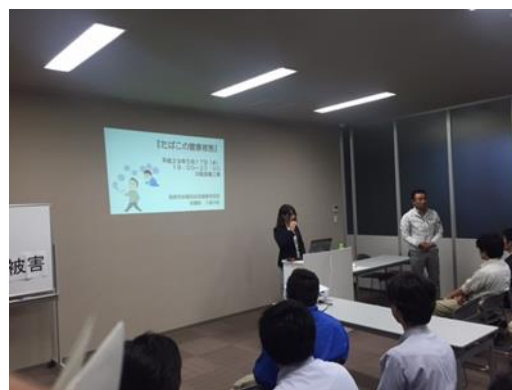
市の出前講座を活用した研修会